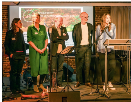
Die Mitglieder des neuen Vorstands stellen sich vor.