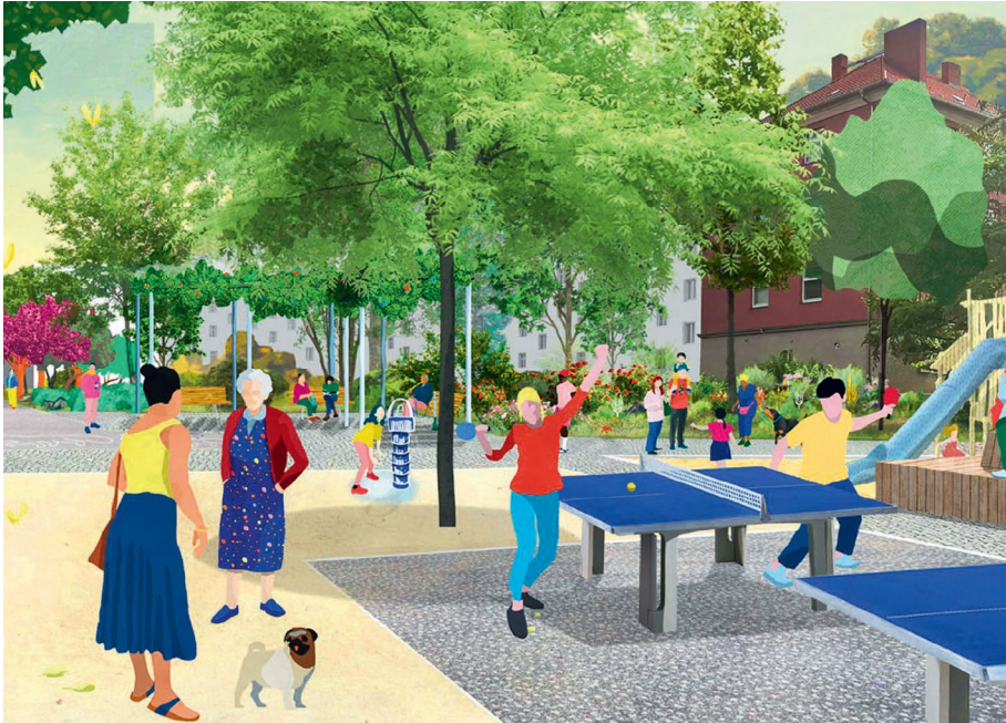
Quartiersplatz im „Rosengarten“, Berlin-Reinickendorf von hochC Landschaftsarchitektur

W ie können unsere Städte angesichts des demografischen und biografischen Wandels – einer alternden Gesellschaft und vielfältiger werdender Lebensentwürfe – so gestaltet werden, dass sie auch künftig für ältere Menschen und darüber hinaus für eine breite Vielfalt an Bedürfnissen lebenswert bleiben? Dabei geht es um mehr als nur bezahlbaren Wohnraum: Gefragt sind nachhaltige, barrierefreie und gesundheitsfördernde Quartiere, die über alle Lebensphasen hinweg funktionieren.